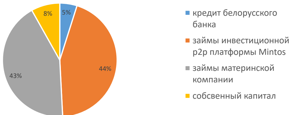
Структура фондирования лизингового портфеля